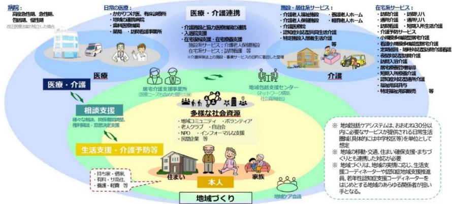
第130回 社会保障審議会 介護保険部会 (令和7年12月1日) 資料2より 一部抜粋

今後は、高齢者人口の変化によるサービス需要の地域差や、介護人材不足といった課題を踏まえ、市町村や都道府県が地域の特性に応じて自主的・主体的にシステムを構築・深化させ、利用者に切れ目ないサービス提供と地域づくりを推進していくことが求められている。